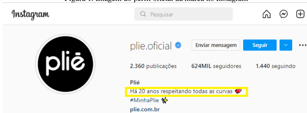
Figura 1. Imagem do perfil oficial da marca no Instagram