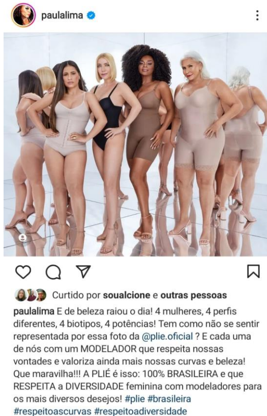
Figura 6. Post no perfil da cantora Paula Lima