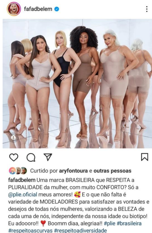
Figura 7. Post no perfil da cantora Fafá de Belém