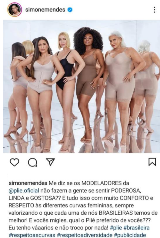
Figura 5. Post no perfil da cantora Simone