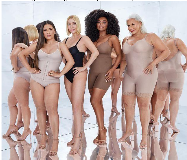
Figura 2. Imagem da campanha Todas por una voz

Enquanto texto multimodal, a campanha Todas por una voz apresenta uma inter-relação entre imagens e texto linguístico que também são responsáveis pela configuração dos sentidos. Assim sendo, antes de partirmos para a análise linguístico-discursiva, gostaríamos que focar nossa atenção nos sentidos que são configurados pela representação visual das cantoras que participam da campanha (Figura 2). Para tanto, selecionaremos o aporte teórico-metodológico da Gramática Visual (GDV), proposta por Kress e van Leeuwen (2006), especificamente da função interativa, isto é, a maneira como a composição visual mobiliza recursos para constituir e manter a interação com as observadoras da imagem (as interactantes).