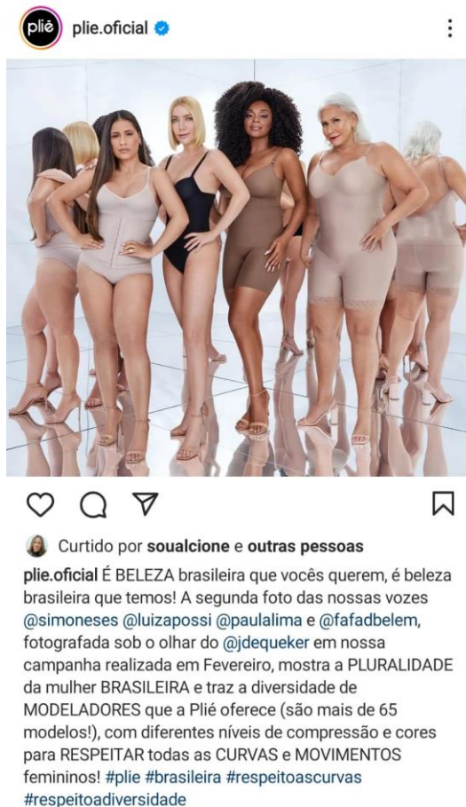
Figura 3. Post publicado no perfil da marca