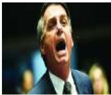
Figura 4 10

cores e disposição na tela, num processo que pode ser lido enquanto textualização da imagem, na medida em que se compreende este enquanto articulação de processos tanto verbais, quanto visuais no seio da argumentação.