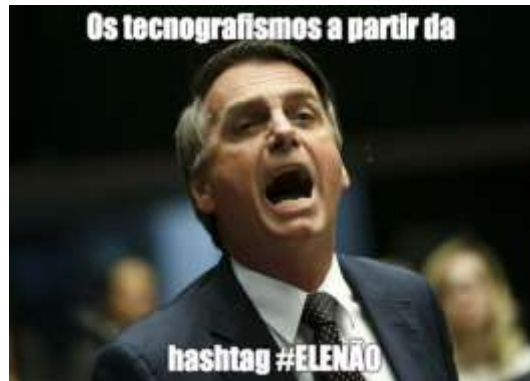
Figura 3 - Meme Bolsonaro gritando pronto 8

A imagem ridiculariza o então candidato na medida em que o flagra em um momento de fala, com a boca aberta, representando a cenografia 9 de alguém que está gritando. De acordo com Robert Entman, o enquadramento (framing) pode ser definido enquanto “seleção de alguns aspectos de uma realidade percebida de modo a torná-los mais destacados em um texto comunicacional” (Entman, 1993, p. 52).