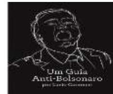
Figura 11 17

A primeira imagem (Figura 4), veiculada na revista Veja - uma das que mais circulam no Brasil -, na sua versão digital em maio de 2018, foi apropriada pelo movimento #EleNão em setembro do mesmo ano e viralizou na internet. Publicados entre 12 de setembro de 2018 e 20 de outubro de 2018 (ver datas correspondentes nas notas no final do artigo), os tecnografismos apresentados demonstram, ainda, sua ligação temporal ao momento histórico do movimento #EleNão, que ocorreu em 29 de setembro do mesmo ano. Além disso, estes tecnografismos destacaram a boca aberta do então candidato, corroborando o ethos de intolerância de Bolsonaro.