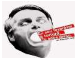
Figura 9 15