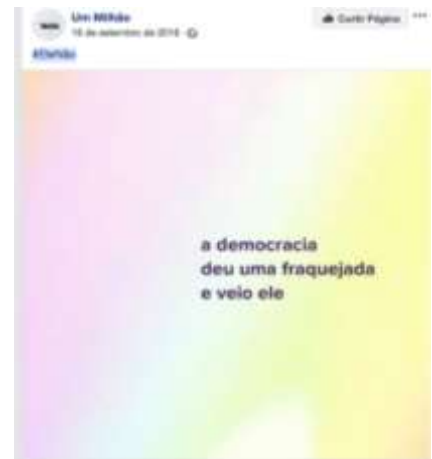
Figura 14 - Texto verbal com fundo de apelo visual no Facebook 20

É possível observar a prática de iconização do texto, feita a partir da foto de um texto que circulou na mídia. Um segmento verbal torna-se então um texto fotografado (Figura 12, screenshot de uma reportagem e Figura 13, foto da página de um livro), é publicado e compartilhado como uma foto na rede social e na mídia em geral. Até mesmo um fundo colorido e um padrão para escrever um texto tornam-se mais imagem que texto, por meio do processo de iconização (Figura 14).