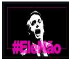
Figura 5 11