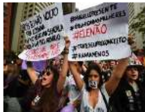
Figura 16 22