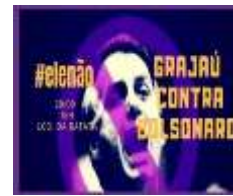
Figura 7 13