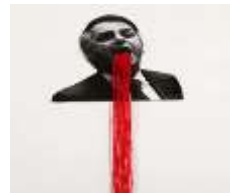
Figura 10 16