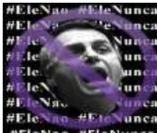
Figura 8 14