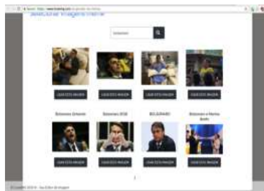
Figura 1 - Escolha da imagem macro

Sites e aplicativos que produzem memes propõem essa imagem para manipulação, mas nosso interesse aqui não reside especificamente em analisar apenas o meme, mas sim a apropriação da imagem que passa pelo processo de textualização no seio da argumentação do movimento #EleNão. A seguir apresentamos um site que propõe a imagem para manipulação e produção final de memes, fato que corrobora a reflexão sobre o processo de textualização da imagem, característico deste tipo de produção nativa da Web: