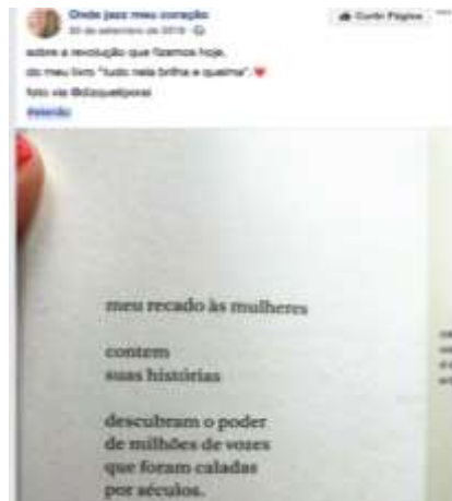
Figura 13 - Fotografia do texto verbal de uma página de livro 19