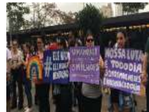
Figura 17 23

Paveau (2017a, p. 310) afirma que " la pratique du screenshot de texte présente en effet plusieurs traits technodiscursifs qui intéressent directement la définition même du texte et de la textualité " (Paveau, 2017a, p. 310), uma vez que tanto a captura de tela quanto a fotografia do texto alteram os processos de produção textual, bem como sua leitura e recepção.