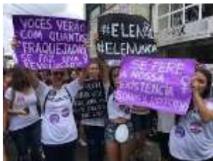
Figura 15 21

A seguir podemos observar a iconização do enunciado #EleNão fotografado e disseminado na rede a partir do funcionamento da fotografia, não mais do texto verbal articulável.