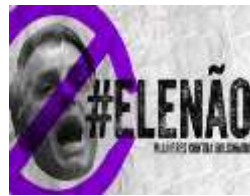
Figura 6 12