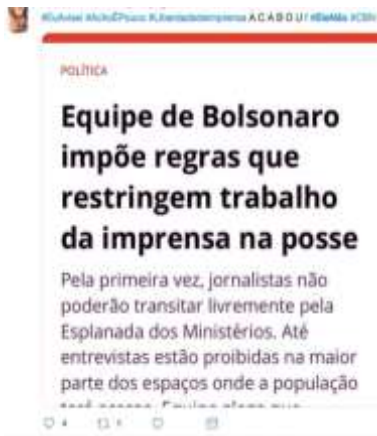
Figura 12 - Screenshot do texto verbal de reportagem online 18

De acordo com Paveau " sur le réseaux sociaux se développe de plus en plus cette pratique de screenshot de texte ou de photographie de texte " (Paveau, 2017a, p. 309); de outro modo, o internauta fotografa o texto e o compartilha como imagem. A captura de tela é, com efeito, um exemplo de iconização do texto. Observemos a seguir como esse processo foi mobilizado pelo movimento #EleNão a partir de alguns recortes: