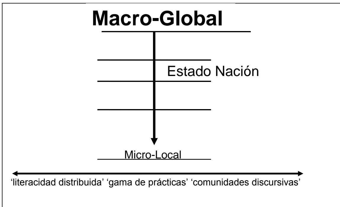
Figura 2. Reconceptualización de las escalas verticales y horizontales de lo global y lo local.

Al mismo tiempo, la escala como una metáfora social sigue teniendo una dimensión horizontal, y las metáforas horizontales establecen cimientos teóricos importantes. En la sociolingüística, los términos de la dimensión horizontal que permean la literatura incluyen ‘literacidad distribuida’, ‘diseminación’, ‘comunidad de práctica’, ‘comunidad discursiva’ y ‘gama’ de prácticas de literacidad. Por lo tanto, el concepto de escala, “no rechaza las imágenes espaciales horizontales; las complementa con una dimensión vertical de ordenamiento jerárquico y diferenciación del poder” (Blommaert 2006).