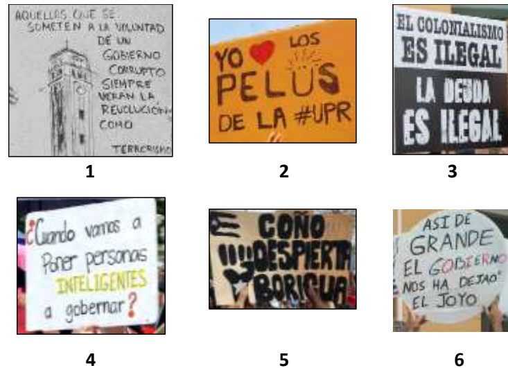
Figura 4. Pancartas representativas de los códigos 1 al 6.

En la Figura 4 se hacen evidentes las marcadas diferencias semánticas y semióticas entre las pancartas representativas de los diferentes propósitos comunicativos identificados. Es importante señalar que en los códigos 3 al 6, la reflexión, indignación o frustración que se pretende puede tener, en teoría, el propósito último de persuadir o convencer, pero los recursos comunicativos del mensaje no son suficientemente específicos para llegar a esa conclusión. Analizamos la frecuencia relativa de pancartas por cada código pues estos totales sirven como representaciones de importancia relativa en el mensaje colectivo, y como descriptores generales de los subgrupos de propósitos comunicativos.