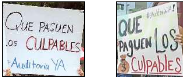
Figura 2. Pancartas con el mismo texto, pero recursos semióticos diferentes.

Una vez formado el corpus, asignamos un número a cada pancarta y creamos una base de datos, digital e impresa, con la totalidad de las imágenes. Es necesario señalar que hubo algunas pancartas con mensajes de texto idénticos, pero se clasificaron como diferentes y se analizaron por separado porque contenían diferentes recursos semióticos (ver Figura 2).