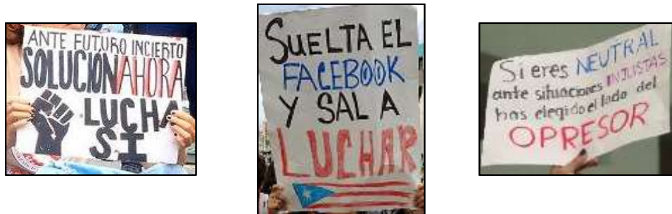
Figura 1. Variedad de recursos semióticos en las pancartas estudiadas.

Finalmente, la voz colectiva que es objeto de este estudio también se analizó por medio de recursos semióticos como, por ejemplo: el uso selectivo de colores, letras mayúsculas, grosor de las líneas y distribución del espacio textual, entre otras técnicas de comunicación a través del texto y la imagen (ver Figura 1). Por ejemplo, Clemente (2012) concluye que: “El mensaje de protesta corresponde más a una locución gritada que a una locución hablada y ésta se expresa mejor con la mayúscula, tal como vemos en el cómic”.